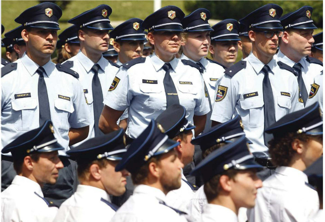
Novi karierni sistem naj bi zaposlene spodbujal k samoiniciativnosti ter jih hkrati pripravil za prevzem vodilnih mest. Za zadnje bi jih tudi simbolično finančno spodbudili.